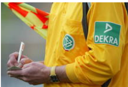
Bitte notieren: Der Fußball benötigt Schiedsrichter.

Woche für Woche sind 78.617 Unparteiische im Einsatz. Die meisten Unparteiischen gehören dem Bayerischen Fußball-Verband (15.127) an, es folgen Niedersachsen (11.579), Westfalen (6.973) und Hessen (6.829). 63.265 Schiedsrichter sind über 18 Jahre und 13.166 sind unter 18, darüber hinaus sind 2.186 weibliche Unparteiische. (Stand 30.04.2008)